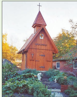
Klosterkapelle in Bergedorf

Den Weg vor den Steinen fahren Sie hinein und gelangen auf die Straße Bei den Gro-ßen Steinen . Hier fahren Sie rechts, bis Sie an der Bergedorfer Landstraße (rechtsseitig) ein weiteres Groß-steingrab 6 erreichen. Nun biegen Sie links ab und sehen kurz darauf den Fernsehturm Steinkimmen 6 in voller Größe. Sie fahren weiter, passieren ein kleines Waldgebiet und biegen rechts in die